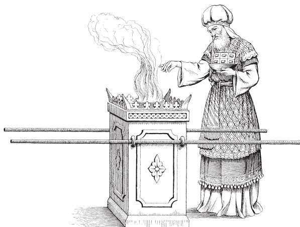
КъурмэнышЫр къурмэниІыпІэм дэжъ (30:1-9; 37:25-29)

22 ЧэтэнІабгъум ычІэгъ чІэлъынэу джэнэ кЫІутелъыр зэрэщытэу цы шхъуантІэм хашъыкЫгъ. 23 Ащ шъхъэи-кЫпІэ фашЫгъ. ДзэкІолІым иджанэ зэрашЫрэм фэдэу, джэнэ кЫІутелъыр шъхъэикЫпІэм дэжъ шызэІымытхьынэу, ащ ынэз кыдекІокІэу пытэу ІуашЫкЫгъ. 24 Ащ ыІэкІапэ зэрэщытэу кыдекІокІэу цы шхъуантІэм, шхъонтІашъор кыызтеорэ цы плъыжь чІапцІэм, цы плъыжьыбзэм, чэтэн Іудэнэ псыгъоэхэм ахашЫкЫгъэу нар теплъэ зиІэ цы такъырхэр шыпашІагъэх. А цы такъырхэм азыфагу дышгъэм хэшЫкЫгъэу одыджын цЫкІухэр шыпалъагъэх. 25 Дышгъэ къабзэм одыджын цЫкІухэр хашЫкІхи, ахэр нар теплъэ зиІэ цы такъырхэм азыфагу, зыр адырэм кыкІэлъыкІоу, джэнэ кЫІутелъым ыІэкІапэ зэрэщытэу шыпалъагъэх. 26 Зиусхъаным МосэкІэ унашгъо кызыеришЫгъэм тетэу, Зиусхъаным фэлэжьэнэу чІыпІэ